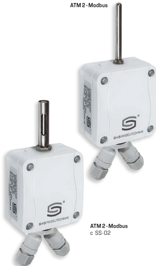
ATM 2 - Modbus с SS-02